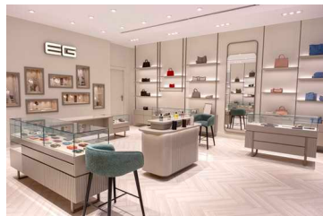
مرکز تجاری دومان