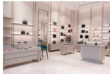
بوتیک مال ملل