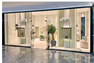
مرکز تجاری پین پلازا شیراز