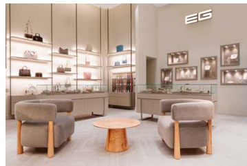
مرکز تجاری اہال